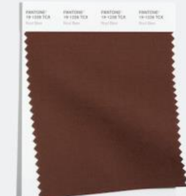
Root Beer 擦树的根皮 象征的香草棕色