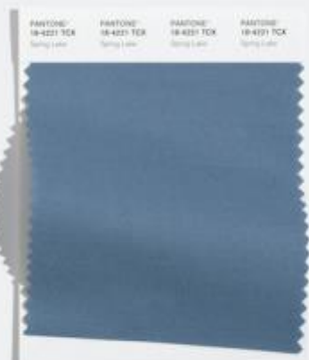
Spring Lake 安静舒适的中调蓝色