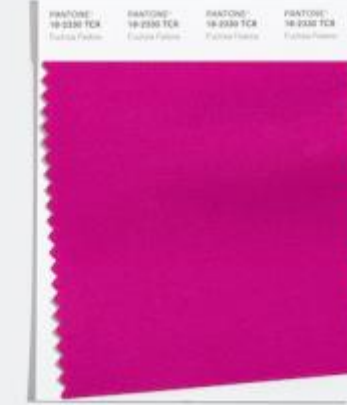
Fuchsia Fedora 魅惑大胆的粉色