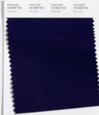
Rhodonite 达到最高的潜力 有帮助的均衡的 以蓝色为基础的紫色