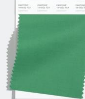
Leprechaun 爱尔兰民画中的 象征神话精灵般的绿色