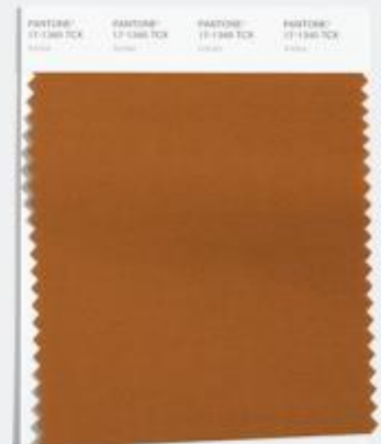
Adobe 温暖且有支撑力的 像晒干的黏土