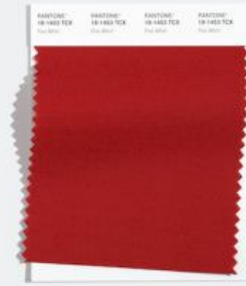
Fire Whirl 有活力的存在感的 强烈的红色