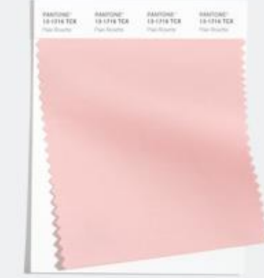
Pale Rosette 可爱又柔软的浪漫粉色