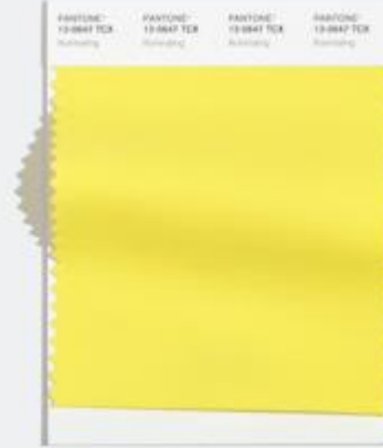
Illuminating 风和日丽的约会 乐观的黄色