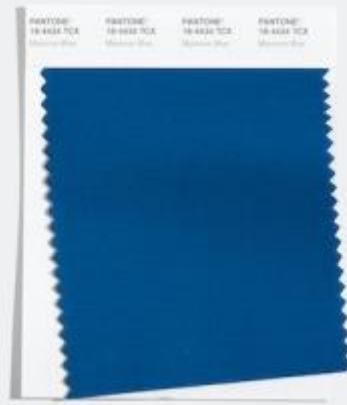
Mykonos Blue 令人联想起太阳的 清爽的蓝色